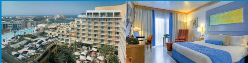
Malta > Suncrest Hotel > 4 stelle

Prenota ora la tua vacanza benessere! a partire da 350,00* euro