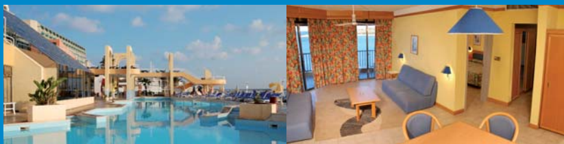
Malta > Intercontinental > 5 stelle

*più: quota di iscrizione > 15,00 / tasse aeroportuali: Palermo > 40,00 Catania > 53,00 Milano Malpensa > 75,00 (+ suppl. pp 110,00) Roma > 75,00 (+ suppl. pp 90,00)