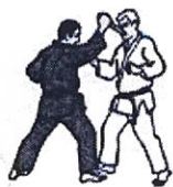
Prima Tecnica Cottellata dall'alto