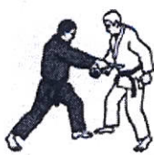
Seconda Tecnica Cottellata al ventre