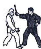
Quarta Tecnica Bastonata dall'alto