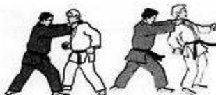
Terza Tecnica Scelta tra strangolamento: - frontale - da dietro