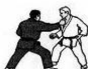
Seconda Tecnica Presa al bavero