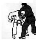
Quarta Tecnica Avvolgimento collo frontale