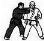
Quarta tecnica Strangolamento laterale