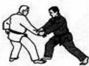
Prima Tecnica Presa al polso